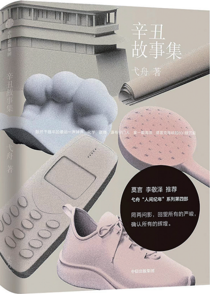
弋舟 著 中信出版社 大方 2022年8月 出版

如何在有限的人生里感悟更多？读一读文学作品里他人的故事，看见更多他人的人生，收获自己的感悟。比如，跟着弋舟的“人间纪年”反思辛丑故事，在皮村文学小组的文字里了解新工人生活，读懂潘向黎上海爱情故事里的都市精神。