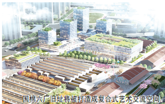
国棉六厂旧址将被打造成复合式艺术交流空间