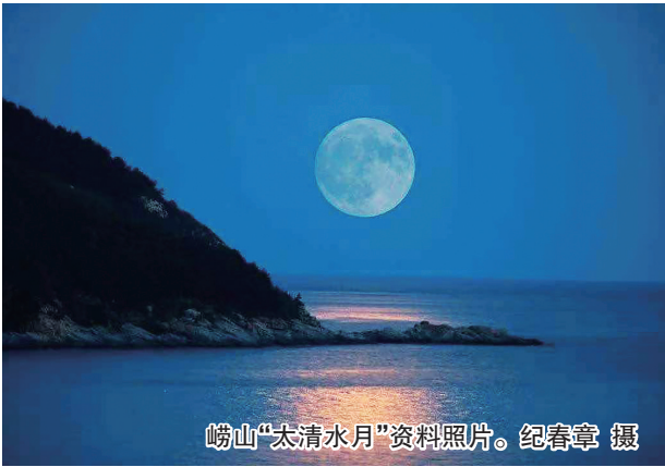
崂山“太清水月”资料照片。

又迎一年中秋佳节，又赏一轮太清水月。崂山作为“海上名山第一”，是中国大陆18000公里海岸线上的最高峰，独特的地理位置优势造就了天然的赏月利好因素。就连清朝的著名才子刘墉在游历太清宫时，看到一轮明月从海中升起，也曾感叹其意境非凡，写下了“太清水月”四个大字，从此太清的月景便有了“太清水月”的美誉，并被收入崂山十二景流传至今。如今，“太清水月”景色常在，其深厚的文化积淀随着时代不断被赋予新的观赏形式，一年一度的“太清水月”引来广泛关注，成为大家寄托“情思、乡愁”的重要载体。如果游客能在中秋佳节