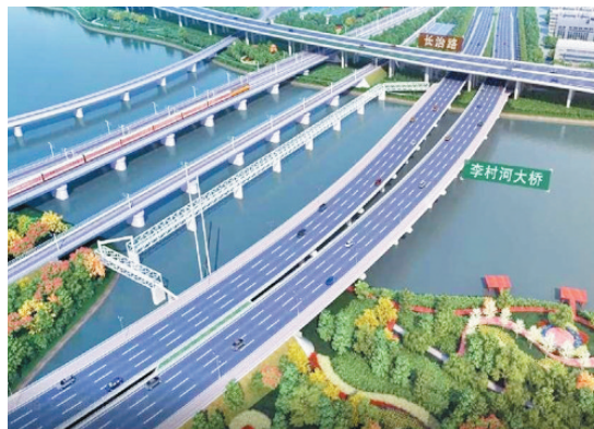
李村河大桥效果图

与此同时，该公司承建的唐河路-安顺路打通工程衡阳路至遵义路段，当天也开始了路面基层施工。