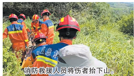
消防救援人员将伤者抬下山。