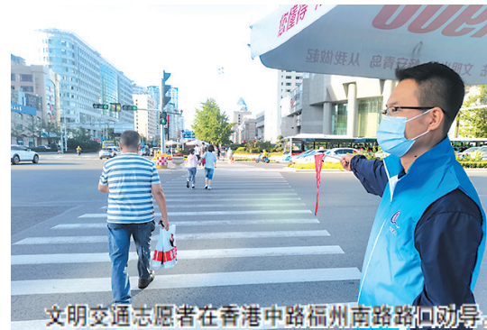
文明交通志愿者在香港中路福州南路路口劝导。

本报8月30日讯 记者从青岛市公安局交通警察支队了解到,为推进全市道路交通管理工作,增强群众的文明交通意识,创造良好的道路交通环境,8月26日起,4700多名文明交通志愿者在香港西路、福州南路等全市1000多个路口协助交警开展工作,通过引导行人、非机动车驾驶人遵守法规,耐心宣传交通安全知识,倡导广大市民争做文明交通的践行者、倡导者。