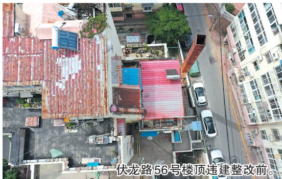
伏龙路56号楼顶违建整改前。