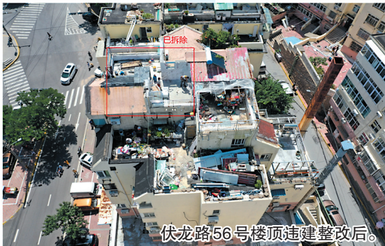
伏龙路56号楼顶违建整改后。

本报8月30日讯 城市更新和城市建设三年攻坚行动启幕以来,市南区将违建治理作为推进工作的先锋阵地,为山头公园整治、老旧小区改造、历史城区保护更新等项目开路打基。截至目前,已超额完成4.3万平方米存量违建拆除任务,拆除存量违建5.4万平方米,实现存量违建清零目标。