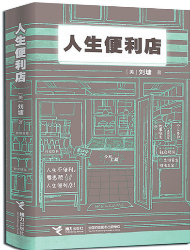
《人生便利店》刘墉 著 接力出版社 2022年8月出版

刘墉在励志作品出版50周年之际,推出了自己的新书《人生便利店》,该书由接力出版社出版。