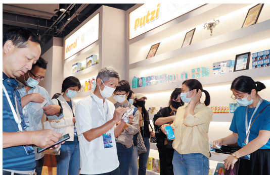
嘉宾们在中德商通展馆现场体验。