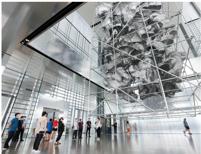
嘉宾们在西海美术馆参观交流。