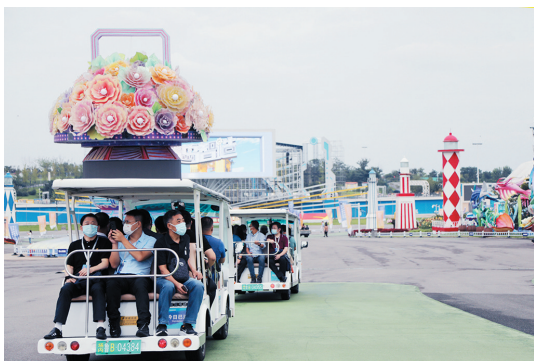
嘉宾们在金沙灘啤酒城参观。

从最熟悉的快消商品，到以品质著称的德国家具，再到口感醇厚的德国啤酒，在位于中德生态园的中德商通展馆里，总编们不仅了解到了中德生态园——这一中德两国政府建设的首个可持续发展示范合作项目的“前世今生”，更对中德商通纯德国进口商品的“德国品质”有了感性的认识。中德商通聚焦快消品、跨境电商、大宗商品、高端消费品四大业务板块，形成从市场调研、产品引进到营销推广、物流仓储的进口贸易全链条服务体系。