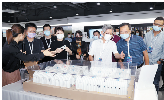
嘉宾们在华大基因北方中心参观交流。