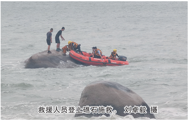
救援人员登上礁石施救。