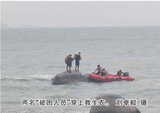
两名“被困人员”穿上救生衣。