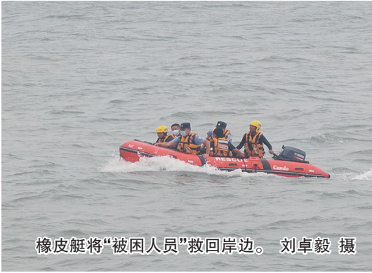
橡皮艇将“被困人员”救回岸边。

站在礁石上看日出、看日落，拍完照片一回头，来时路已经被海水淹没了；到海边网红景点打卡，不留神，海水已经淹没到脚踝……进入夏季旅游旺季，类似的一幕经常在海边发生。为了让救援队员和民警熟悉海边情况掌握救援技能，青岛市海岸警察支队返岭派出所民警联合青岛红十字搜救队，在雕龙嘴码头附近展开了一场联合救援演练。