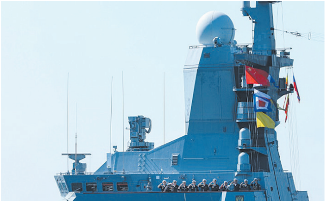
俄“响亮”号护卫舰官兵在甲板整齐列队敬礼。