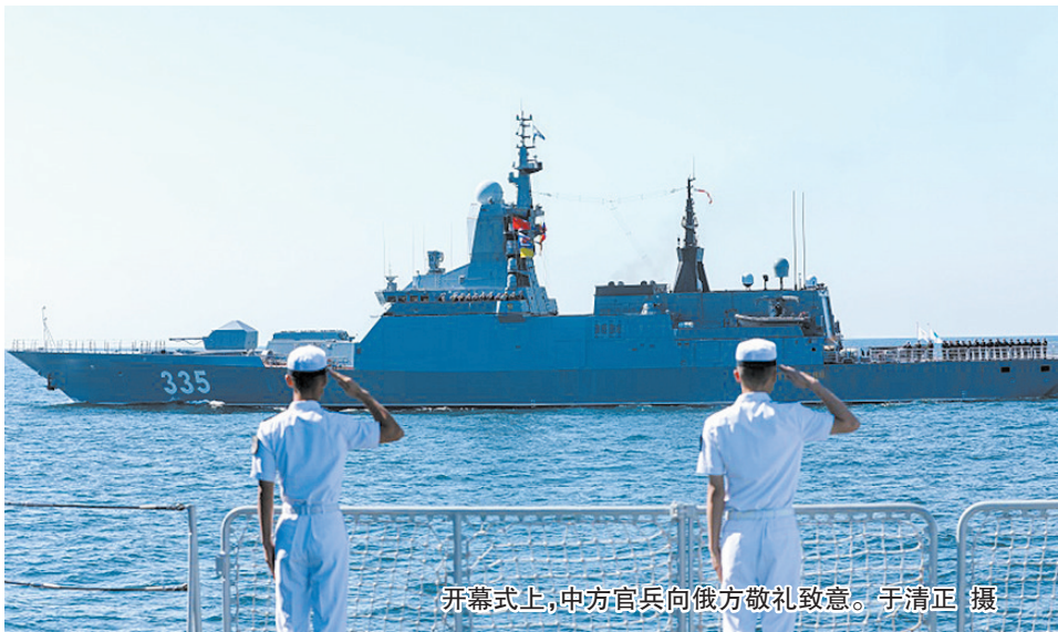
开幕式上,中方官兵向俄方敬礼致意。

本报8月17日讯 蓝天作幕,碧海搭台。17日上午,“国际军事比赛-2022”“海洋之杯”水面舰艇专业比赛(太平洋赛区)开幕式,在青岛附近某海域隆重举行。比赛指挥舰、中国海军导弹护卫舰邯郸舰,中方参赛舰、中国海军导弹护卫舰临沂舰,俄方参赛舰、太平洋舰队“响亮”号护卫舰,悬挂中俄两国国旗,在航渡过程中参加了开幕式。