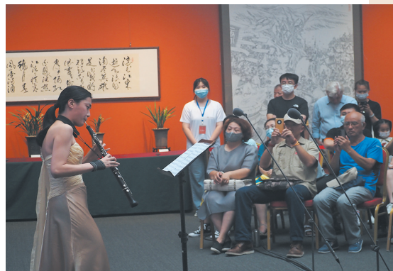
展览与演奏、中西文化碰撞,让美术馆里的音乐季格外具有吸引力。

在参与演出的过程中,音乐家团队对美术馆罗马展厅穹顶所形成的这座纯自然声演奏厅赞不绝口,他们认为在这里直达声清晰,混响声充足,高中低频声场分布十分均衡,无需借助任何扩声设备,即可满足不同频段声音,达到理想的声学效果。天津茱莉亚学院的优秀学子参与了“乐动红墙”之后,希望能够再度感受这种演奏的氛围。而学院的著名圆号演奏家