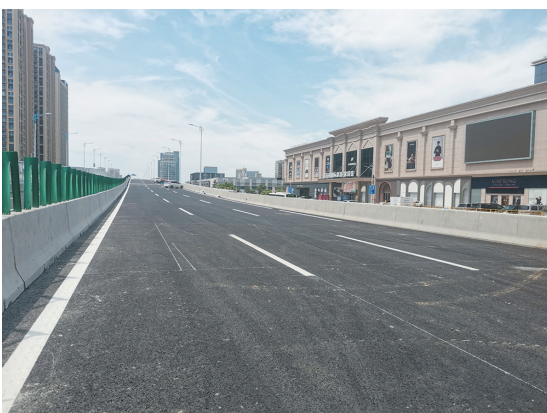
辽阳路快速路(南京路-福州路)主桥已施划道路标线。

条件对施工影响也较大。”施工过程中,每个桩基的埋深18米左右。项目在钢筋梁建设时采用了UH-PC100超高性能混凝土,可有效保障接缝处的施工质量。近期持续高温,为做好防暑降温工作,项目部调整工人作息时间,避开上午11时至下午3时高温时段,同时积极采购防暑降温用品。宋克坤表示,目前,项目已申报山东省绿色施工科技项目、青岛市智能建造应用试点,同时成立了项目QC课题小组,已选择课题并立项,逐步开展QC质量活动。辽阳路快