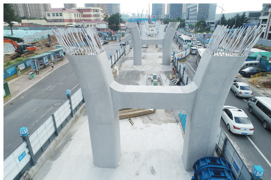
辽阳路快速路(福州路-海尔路)04工区桩基“立正”月底开始架梁。