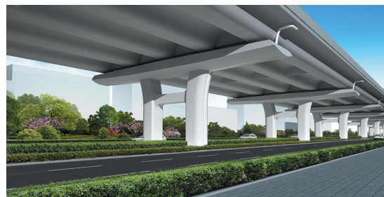
辽阳路快速路(福州路-海尔路)04工区效果图