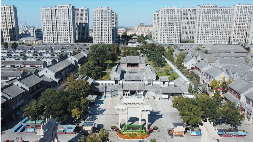
即墨古城南城楼命名为「中和楼」。

即墨古城南城楼命名为“中和楼”，取法中国哲学的中和思想。 “中和”语出《中庸》：喜怒哀乐之未发，谓之中；发而皆中节，谓之和。中也者，天下之大本也；和也者，天下之达道也。致中和，天地位焉，万物育焉。 春秋时期，孔子在“中和”观念基础上，明确提出“礼之用，和为贵”。孔子还提出“和而不同”，主张吸纳不同意见，倡导对立双方协调统一。简言之，就是求中、求和。 即墨拥有悠久的历史，正因凝聚了厚重的历史和文化基因，即墨古城从一诞生就自带流量。 即墨，始载于《战国策》《史记》等典籍，春秋战国时期为齐国名邑，秦代置县，隋朝迁现址建城，即墨大夫刚直不阿、田单破燕、田横五百士、郭琇三疏等典故让即墨昭彰史册。 即墨县治自公元596年迁至现址，至今已有1400多年历史，棚户区改造中诞生的即墨古城项目作为一种城市“再造”，成为青岛历史文化演变的重要见证。 这里面还有一段尘封的故事：1898年的一天，德国信义会传教士卢威廉来到即墨。当地的世俗生活让他颇感兴趣，加上摄影爱好，所以在传教之余，他拿起相机开始记录日常生活。后来，回忆往昔岁月，卢威廉写道：“新日的时光在这里交汇。即墨是一幅微缩的图画。凭借她，我们了解到中国的伟大历史与丰富民俗内涵。” 2005年，63岁的德国汉堡大学语言学教授吴淑曼女士来到即墨，她将收藏多年的卢威廉拍摄的130余张青岛、即墨老照片无偿赠予即墨市田横镇政府。一百年前的老城旧影，就这样重现在世人面前。历史百年，地跨两洲，有关即墨的这段珍贵记忆，终于回到了它们最初诞生的地方。这些都为再造古城提供了重要的史料参考。 在即墨古城的规划设计方面，规划建设指挥部依据清同治版县志、遗存老照片等史料，聘请清华大学清安地建筑设计事务所编制了古城修建性详细规划。邀请建设部原副部长、中国建筑学会理事长宋春华，全国政协常委、中国文联副主席冯骥才，时任故宫博物院院长单霁翔等国内知名专家学者对规划方案进行把脉，历经一年多的时间，反复推敲修改，终成精品。 在建设过程中，城墙石基与街道所铺石板，皆是专人分赴即墨民间搜