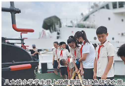
八大峡小学学生登上双鹰舰开启红色研学之旅。

近日,青岛八大峡小学党支部组织党团员教师、少先队员代表走进了学校海洋国防教育基地——中国海警局直属第六局双鹰舰,开展参观交流、慰问表演、实践体验等丰富多彩的红色研学活动。