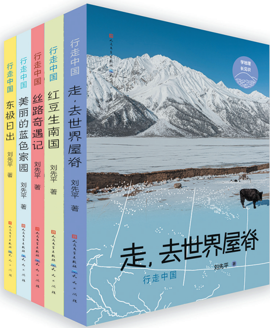
人民文学出版社 天天出版社 2022年6月出版 《行走中国(共5册)》刘先平 著

今年暑期没有远游?别遗憾。用阅读的方式穿越时空,跟着专家学者行万里路,看千年史,穿越时空感受中华文化。 当代大自然文学之父刘先平以广博的见闻、四十余年的探险足迹力作一套汇集中国山川湖海、珍稀生物、人文历史的地理文学启蒙之书;知名儿童文学作家、“蓝皮鼠大脸猫”之父——葛冰推出全新力作,用12个中国历史人物或文物的传奇故事让小读者爱上历史。