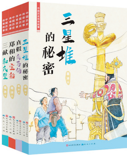
《中国历史传奇故事(共4册)》葛冰 著 人民文学出版社 天天出版社 2022年6月出版

《行走中国》系列共分为《东极日出》《红豆生南国》《丝路奇遇记》《走,去世界屋脊》《美丽的蓝色家园》五册,分别对应着我国地理区域上的北方、南方、西北、青藏地区及海洋生态,内容涉猎我国东北地区、秦岭地区、武夷山区、西双版纳、怒江峡谷、海南橡胶林、沙漠、盐湖、黄河源、自然保护区、南沙群岛、西沙群岛等地的地理地势、水文特点和气候特征。在区域间合并与对比中,地理类型的相似性和差异性得到了有效而直观的表达,助力孩子们归纳逻辑与汇通思维的培养与形成,也让孩子们在批判性的思考中增进自身对于文本内容的理解,习惯性地把书读厚,再读薄。 以说故事、讲地理的方式,刘先平用切身经验反映着一个中国人的伟大理想——“读万卷书,行万里路”。在简明清晰又兼具纪实性与科普性的文字渲染下,孩子们跟随作者的步伐,仿佛也一并跃入大千世界,游览自然名胜、感知风土人情,识百草、阅百花,虽足不出户却能将天地万物和于掌中,亦如孔子云:“多识于鸟兽草木之名。” 不仅如此,在记录行旅生活的游记外表下,《行走中国》更是一本本实质性的地理百科之书。于每一篇随笔后,知识小贴士和干货满满生态笔记的添加,让文本文质彬彬,满足了孩子们对于新奇故事的期待,也在兴趣中达成了吸纳知识的实用效果。这是一系列当代地理志,却也在自然人文的记录中悄悄传递着尊重自然、尊重生命的生态道德理念,以细腻的笔触、真诚的情感唤醒青少年对于生态的关照与环保意识的建立,以平