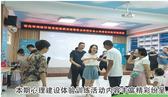
本期心理建设体验训练活动内容丰富精彩纷呈。

本报8月8日讯 疫情以来监狱戒毒警察长期实行封闭执勤制度,对警察心理健康状况造成不利影响。青岛市司法局党委高度重视监狱戒毒警察和律师队伍身心健康工作,先后开展多项爱警、惠警、励警和律师队伍关心关爱活动,在“两狱一所”先后建立警察职工心理健康服务中心。7月23日开始,青岛市司法局区分4个批次,组织监狱戒毒警察和律师带领家属、孩子,来到瑞阳心语综合体验训练基地,系统开展心理健康教育、心理训练、心理测评、心理体验、心理减压等心理建设体验训练活动,调节情绪、减压赋能,全面提升监狱戒毒警察和律师队伍心理健康水平。