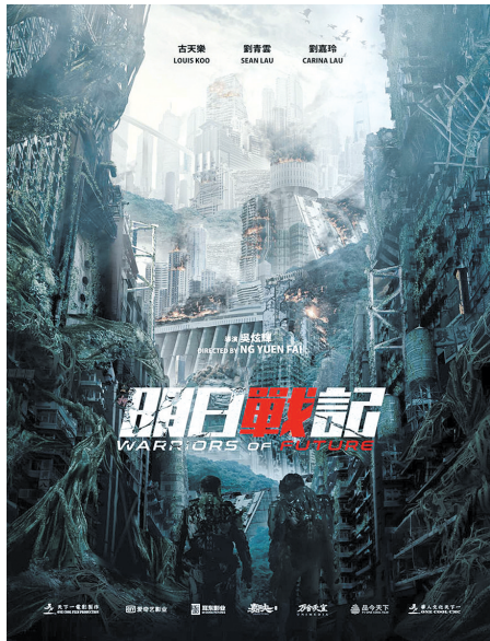
《明日战记》战绩不错

电影《独行月球》上映10天,总票房破20亿;电影《明日战记》上映首日票房过亿。今年暑期档,两部带有科幻元素的影片成为票房热点,尤其是《独行月球》,喜剧+科幻的元素吸引了大批影迷打卡看片,该片上映10天票房已过20亿,成为国内暑期档科幻片冠军。