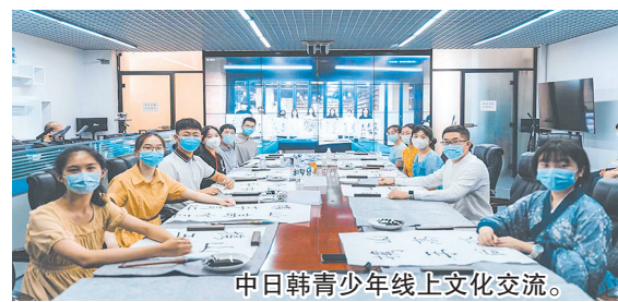
中日韩青少年线上文化交流。

8月6日,由青岛市文化和旅游局、青岛市教育局、日本新潟市役所文化体育部、韩国清州市共同主办的2022“东亚文化之都”青少年线上交流活动顺利举行。青岛实验高中、青岛电子学校派出17名学生分别与韩国清州市、日本新潟市高中学生通过线上会议方式展示各自城市的传统文化、旅游景观和特色美食,并就对方的学习生活、兴趣爱好等内容进行自由讨论。