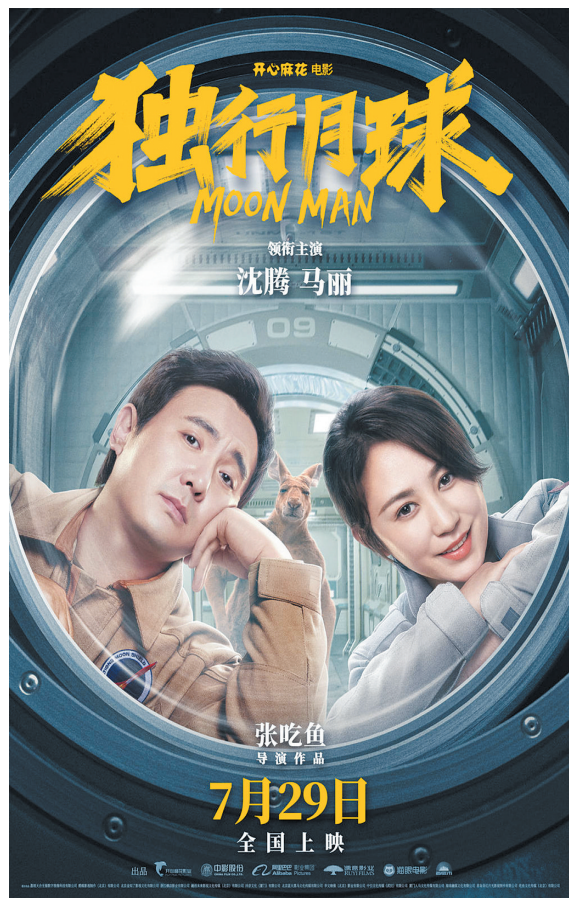
《独行月球》成为暑期档头部大片

球大战。该片也是科幻题材,由吴炫辉执导,古天乐、刘青云等主演。电影以“机甲+科幻+未来战争”为题材,背景故事设置在未来世界,彼时地球深受污染和全球变暖问题的内忧外患,一颗陨石坠落带来杀伤力极强的外星植物,人类遭遇前所未有的危机。讲述了在未来世界的末世危机之下,机甲战士泰来(古天乐饰)、郑重生(刘青云饰)挺身而出,为拯救地球重装出击的故事。这部电影耗资4.5亿元,使用了1700多个特效镜头。前期准备和拍摄用了3年,后期特效用了4年。值得一提的是,《明日战记》没有模仿日本或美国机甲的设定,而是有机结合了中国古代神话的元素,开辟了中国机甲软科幻电影的新尝试。