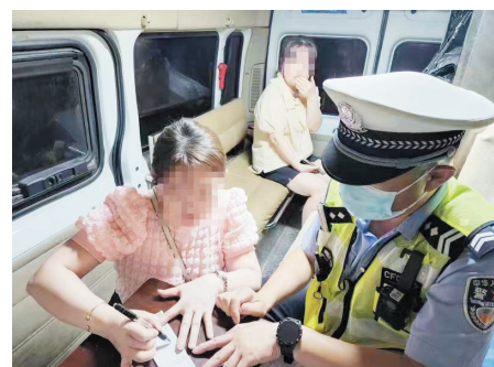
两名酒驾的女子被城阳交警查获。