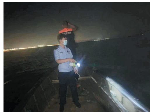
8月6日晚，民警和救生队员在胶州湾东岸乘船搜救。

8月6日深夜10时30分许，白泥地公园南侧约一公里处，一名男子酒后到环湾路西侧的胶州湾里游泳时失联。接到同伴的报警后，青岛市公安局海岸警察支队海口派出所、青岛市消防救援支队和多支社会救援力量到场搜救，出动船艇、无人机等装备。经过彻夜搜救，8月7日一早，救援队员找到了失联男子，可他已经不幸离世。