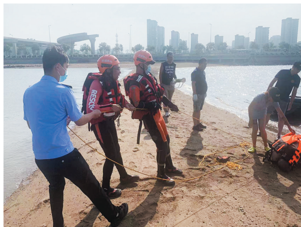
民警、消防救援人员、救生队队员正在海边施救。

一名知情者告诉记者，失联男子是本地人，当晚10时30分许，他与朋友一起到环湾路西侧下海游泳，