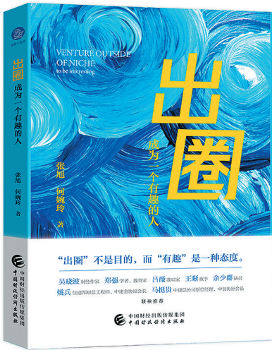
张旭 何婉玲 著 中国财政经济出版社·大观 2022年8月出版

莎士比亚说过:“幽默和风趣是智慧的闪现。”做一个好玩的人,过一种有趣的生活,是人生的追求,更是人生的境界。但是,什么是有趣,如何成为有趣的人,却不那么简单。《出圈:成为一个有趣的人》这本书从“生命在于折腾”“要好玩,先丰富自己”“世界越玩越大”“人生就要好玩”等各个生命和生活的维度出发,打破界限,寻找