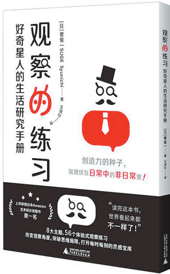
[日]菅俊一 著 广西师范大学出版社 2022年6月出版