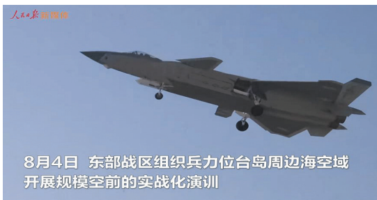
8月4日 东部战区组织兵力位台岛周边海空域开展规模空前的实战化演训

东部战区空军和东部战区海军航空兵出动上百架歼击机、轰炸机等多型战机，奔赴台岛北部、西南、东南空域，执行跨昼夜联合侦察、空中突击、支援掩护等任务。10余艘驱护舰连续位台岛周边海域展开，实施联合封控行动，对火力试射区域进行扫海警戒，配合友邻兵力进行侦察引导。