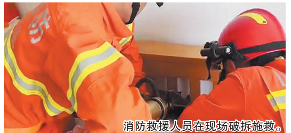
消防救援人员在现场破拆施救。

本报8月3日讯 2日上午，同安路一小区内发生险情：一名老太太为了取出掉落在床底的痒痒挠，胳膊卡在了床缝中。银川路消防救援站救援人员到场后了解到，这名七旬老人试图从床头缝中拿出掉落在床底的痒痒挠，导致肘关节卡在床头木板缝隙中。救援人员到场前，老人曾多次尝试将胳膊收回，可不但没有成功，肘关节已经发红肿胀。救援人员首先使用液压扩张钳对木板缝隙进行第一次扩张，另一名救援人员在一旁扶着老人尝试将胳膊抽回。随着木板之间缝隙逐渐扩大，老人最终抽回了手臂。