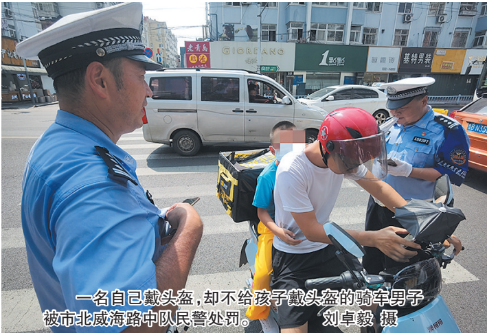
一名自己戴头盔，却不给孩子戴头盔的骑车男子被市北威海路中队民警处罚。

8月3日，岛城迎来高温天气，地表温度超过50℃。但交警对于交通违法的查处并没有放松。当天上午和中午，记者跟随一线交警在台东、李村商圈执勤，查处多起摩托车、电动车的违法。