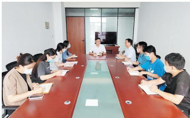
莱西市地方金融监管局帮助企业梳理发展难题。