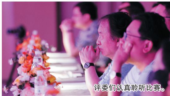
评委们认真聆听比赛。

享受青岛的夏日,享受琴岛的琴音。这个假期,第十届门德尔松国际钢琴比赛亚太总决赛在青岛圆满落幕。在颁奖音乐会上,大赛总监冯键教授宣布了第十一届门德尔松国际钢琴比赛的启动,“一个永不落幕的门德尔松国际钢琴比赛在美丽的青岛开启”。大赛相关负责人表示,门德尔松国际钢琴比赛不仅深深扎根青岛,而且每年创新,每年升级,已经成为艺术城市的亮丽音乐名片。