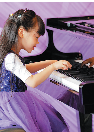
小琴童在比赛现场快乐演奏。