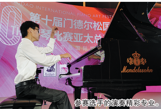
参赛选手的演奏精彩专业。

的机会,大赛把最后一轮巅峰对决比赛开放坐席,让所有的选手都有机会观摩到最优秀选手们的比赛全过程,学习他们的优点增长比赛的经验。