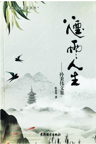
孙秉伟 著 黄海数字出版社 2022年6月 出版

《我的百科人生》以第一人称视角,展现了国家最高科学技术奖获得者、中国科学院和中国工程院院士吴良镛先生极富传奇色彩的百岁人生。全书既体现了百岁国匠“读万卷书,行万里路,拜万人师,谋万家居”的家国情怀,又展示了一代