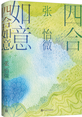
张怡微 著 人民文学出版社 2022年7月出版

小西在海边长大,海即是诗人生活的背景,“我经常和朋友说,真是太爱青岛了,太爱我们的大海了。”天天生活在海边,感受大自然带给自己的震撼,感受每一种蓝的变化,“在潮汐涌动之间,更感谢它带给我创作的灵感。”小西的诗歌《一小块大海》写这样的大海:寒潮来临/我们的大海变得结实/浪花已经卷不动了/停在岸边。一个好奇的孩子,拿着铁铲/铲掉一小块大海带回了家/他很兴奋,把这一块大海/放进客厅的盘子里/之后他伸出/一个胖乎乎的指头/一股直径约为十毫米的暖流/即将穿过大海零下十七摄氏度的身体……小西说,大海从来没有开口说过话,却无时无刻地给予我们教诲。所以在书名的选定上,用了《深蓝》,“首先它代表我所在的地理位置(大海),其次我觉得深蓝是一种中年的颜色,‘内敛冷静,带着毛边’,也是步入中年的自己的写照吧。”步入中年,坚持写诗,坚持写诗的初心。小西认为坚持这个词,只有真心热爱才能做到。只要热爱了,就是无上的动力。凡是让我们轻易放弃的事情,一定没那么热爱。“海的无限和诗有着共通的地方,有谁到过大海的尽头?有谁敢说写完了所有的诗?诗歌太神秘了,你一旦进入其中,就很难做到浅尝辄止。探索它,追寻它,也许就是坚持下去的意义吧。”