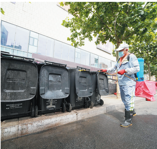
环卫工人正在清洗垃圾桶。

本报7月19日讯 1个月内清洗全区2200多个垃圾桶、34部专业保洁车辆紧盯雨水冲来的泥土污渍、全力做好全区166座公厕的日常保洁……7月19日记者从李沧区了解到,进入夏季,2700多名环卫工人在保证城区环境卫生的前提下,做实做细各项工作,大力发挥创城主力军的作用。