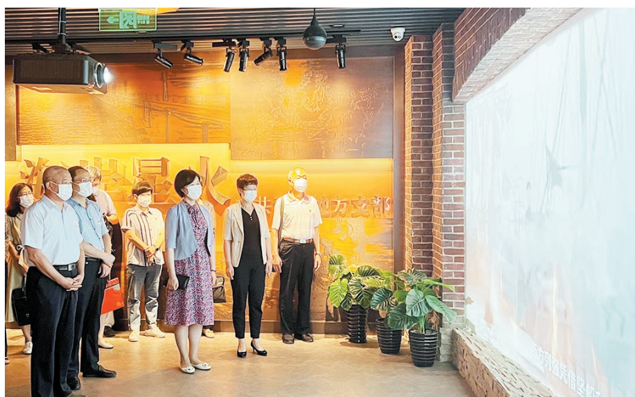
主会场参会人员参观了海岸星火专题展。

本报7月18日讯 为深化拓展“百人千场”宣讲活动,推动党史学习教育常态化长效化,18日下午,我市红色宣讲团成立暨“百人千场”系列宣讲活动启动仪式在中共青岛党史纪念馆举行。