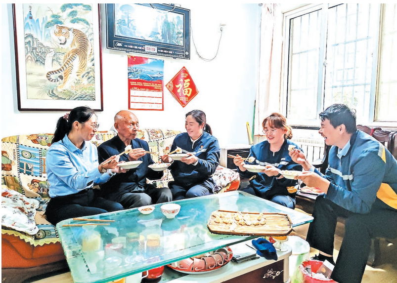
真情巴士志愿者看望空巢老人。