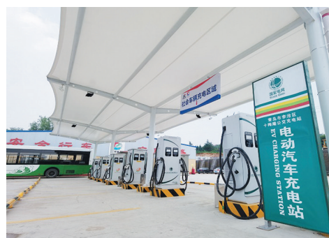
大功率充电站方便纯电动车充电。

本报7月15日讯 李沧十梅庵附近上万居民，给纯电动车充电更方便了。15日上午，十梅庵公交停车场内一排崭新充电桩投入使用。新增设的充电桩终端均为80kw-160kw大功率设备，一桩双头，电力十足，100分钟即可“喂饱”一辆电动公交。不仅如此，充电站还新增“高智商”充电实时监控网络，每辆车的充电情况后台一目了然。工作人员借助大数据统计，错峰用电、削峰填谷，对夜间充电排班的管理更精细，