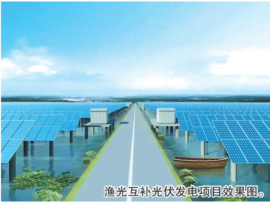
渔光互补光伏发电项目效果图。

本报7月15日讯 近日，总投资2.5亿元的渔光互补光伏发电项目落户青岛西海岸新区，将进一步探索乡村振兴和可持续发展有机结合新路径，推进实现“碳达峰、碳中和”目标。 据悉，该项目由三峡集团与王台街道携手合作开发建设，占地面积约1000亩，规划建设60兆瓦光伏发电项目。这一项目的特点是在充分利用好太阳能资源的同时，因地制宜利用板下区域配合当地养殖户进行水产养殖。项目拟采用足功率540瓦双面双玻的光伏板约11万块，预计年平均上网电量约10375万千瓦·时，每年可节约标煤8200吨。 据介绍，渔光互补项目建成后 will 形成“上发电、下养殖”的新型发电模式，充分发挥渔光互补项目优势，实现土地综合利用与新能源产业有机结合、共赢发展。同时，这一项目具有可观的经济效益、生态效益，对推动“芯屏”产业新城绿色可持续发展具有重要意义。“下一步，街道各部门将积极帮助项目解决建设过程中遇到的各类问题，营造良好的生产生活环境，助力项目顺利推进，争取实现早开工、早投产、早发电。”王台街道相关负责人表示。 近年来，王台街道加大招商引资力度，一批质量高、规模大、科技创新、环保节能的大项目纷纷扎根落户，京东方、富士康、中南高科等重点企业竞相入驻。王台老工业区作为全市开发建设的十大重点低效片区之一，截至目前已吸引总投资328.5亿元的46个市、区项目，王台已经成为投资的高地、创业的沃土。 （观海新闻/青岛晚报 记者 于波 实习生 薛筱蕙 通讯员 董梦瑶 封宇泽）