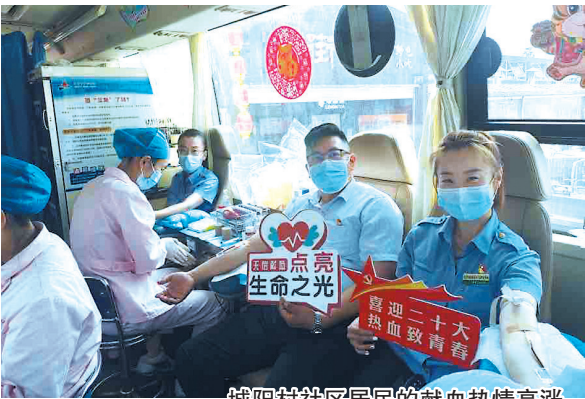
城阳村社区居民的献血热情高涨。

本报7月12日讯 记者从青岛市中心血站获悉,青岛市第11个美丽乡村爱心献血驿站落户城阳村社区。当天,青岛市中心血站两辆献血车开进城阳村社区民生商贸城广场,短短一上午114人献血40800毫升。