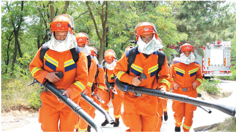
莱西市森林消防中队的救援人员在大青山巡查。

烈日当头，提醒大家预防森林火灾一刻也不能松懈。上山灭火，不同于普通的火灾扑救，考验着消防救援人员的体力、技能、经验等方方面面。近日，记者走进莱西市森林消防中队，听这群身着火焰蓝制服的小伙子们讲述如何在党旗光辉映射下，用热血和青春守护森林的故事。