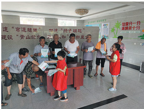
小志愿者介绍生活垃圾分类投放指南。

本报7月6日讯 日前，为了进一步宣传垃圾分类相关知识，在胶州市里岔镇垃圾分类宣教室，来了两位小志愿者，为大家带来生动有趣的垃圾分类宣传活动。