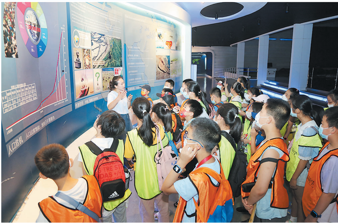
▲晚报小记者们在夏令营收获前沿海洋科普知识。