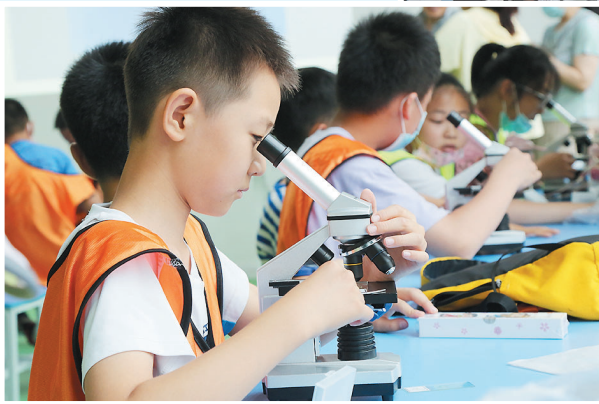
◀显微镜下观察海洋生物。