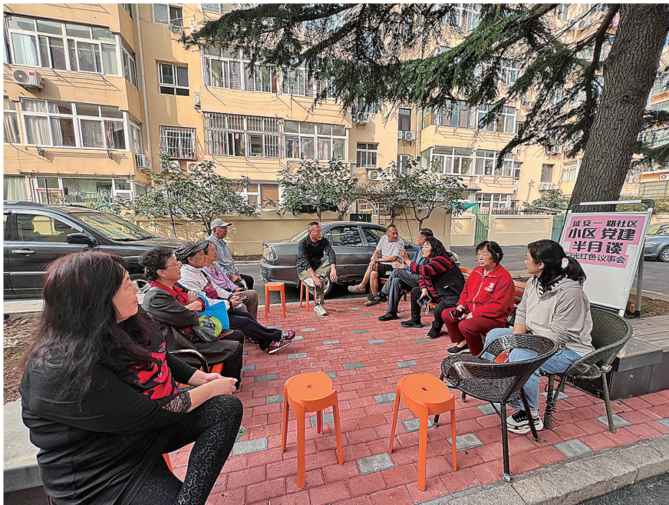
■延安一路社区阳光红色议事会。

居民是小区治理的关键主体。“身边党建”不是替群众当家，而是把平台搭好，充分激发居