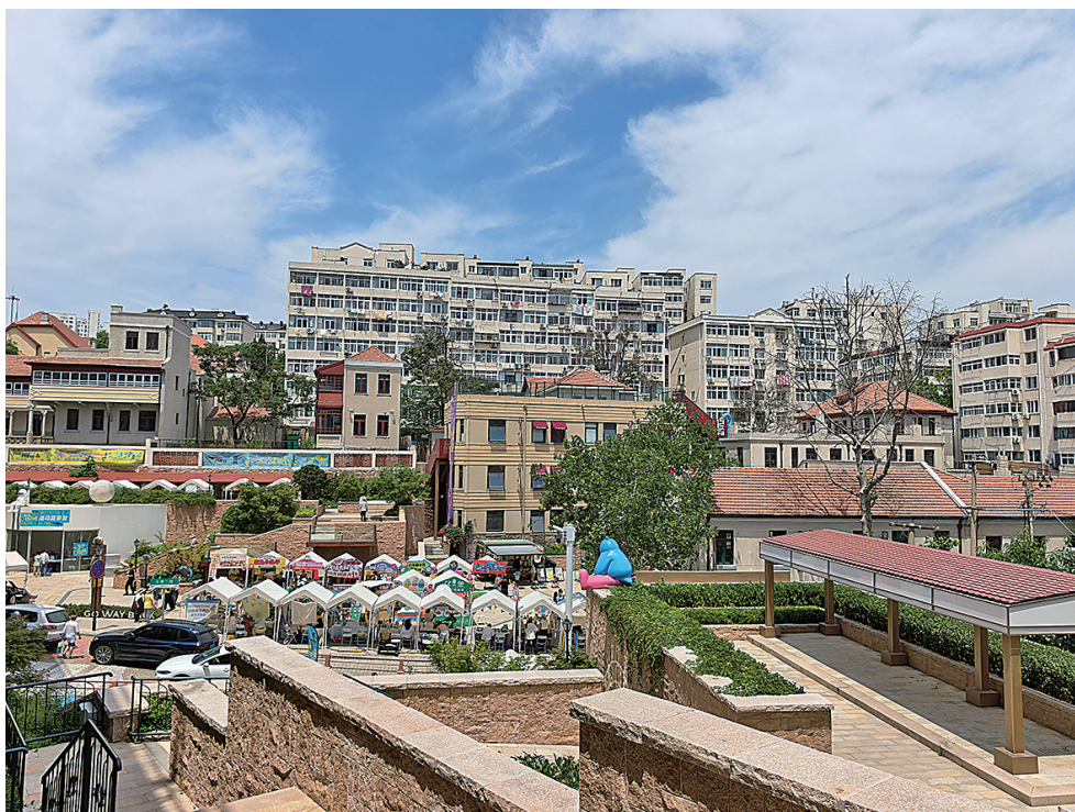
■“波螺油子·拾贰阶”焕新归来。

间——螺美术馆展出，该展览联合独立插画师与青岛市插画协会，共同呈现青岛走读计划综合插画展，持续至9月13日。位于热河路13号院外的“波螺油子·拾贰阶”艺术市集，以老照片、街区和光影叠映为线索，呈现百年老街的时间记忆，构建跨越时空的视觉对话，带市民游客回望这条百年老街的烟火记忆，展览将持续至8月28日。