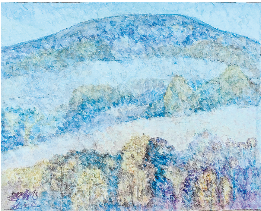
■水彩画《望山》 赵鹏飞

太平角区域的小环境,融山海、林木之气象,空气清冽,静谧宜人,百余年以来,一直是避暑疗养的胜地。1934年夏,郁达夫、王映霞夫妇来青避暑,在此曾写下“湛山一角夏如秋”的赞辞。