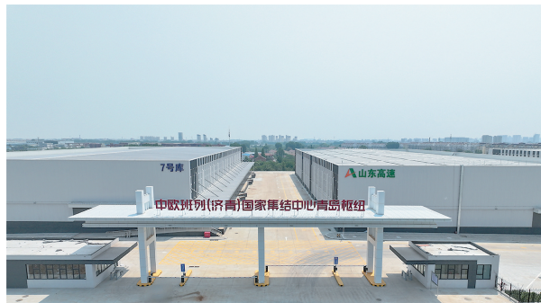
■构建国际物流大通道,青岛将加快建设中欧班列(济青)国家集结中心青岛枢纽。