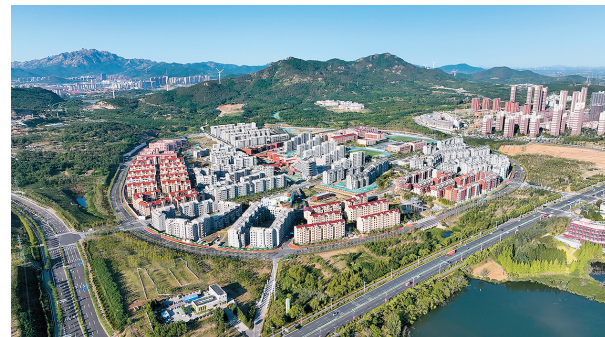
■中德生态园未来城D2组团入选全国首批零碳社区示范项目。

全市生产总值连续三年跨越“千亿台阶”,全国先进制造业百强市排名跃升至第六位,新能源装机容量占电力总装机容量比重突破60%——山东绿色低碳高质量发展先行区获批建设三年来,青岛勇担“强龙头”使命,实现了规模能级与质量效益的同步提升。