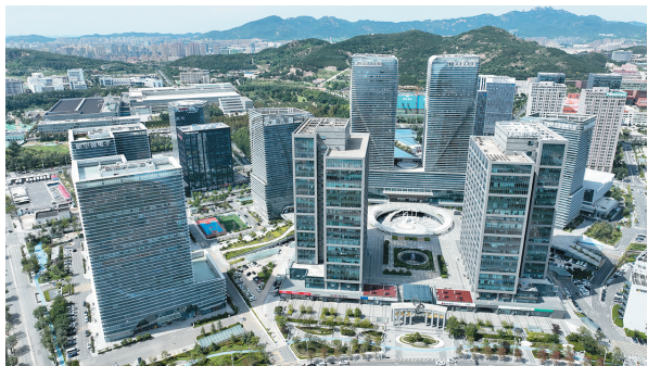
■青岛市人工智能产业园是国家人工智能创新应用先导区的核心载体。