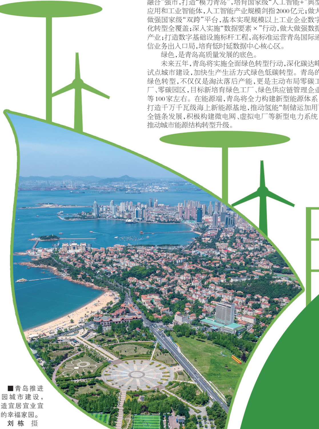
■青岛推进公园城市建设,打造宜居宜业宜游的幸福家园。