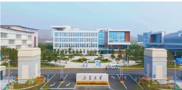
■全国唯一的康大大学坐落于青岛,将有力推进“中国康湾”建设。

过去三年,青岛交出的民生答卷可圈可点:新增就业37.3万人,扶持创业4.1万人;新建改扩建中小学220所,康大大学建成招生;连续六年上榜“中国最具幸福感城市”;城乡居民收入比缩小至2.15。这些数据勾勒出一幅共建共享的温暖图景。