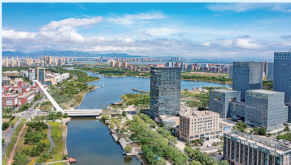
■青岛高新区以“三改革三协同”打造“六园同创”的“无废园区”建设样板。

2025年，全市细颗粒物(PM 2.5 )年均浓度降至24微克/立方米，优良天数达325天，空气主要污染物年均浓度连续6年达到国家二级标准，“青岛蓝”成为抬头可见的常态；全市20个国省控地表水断面水质达标率保持100%，劣V类水体连续5年保持清零，近岸海域水质优良面积比例稳定在99%以上的优异