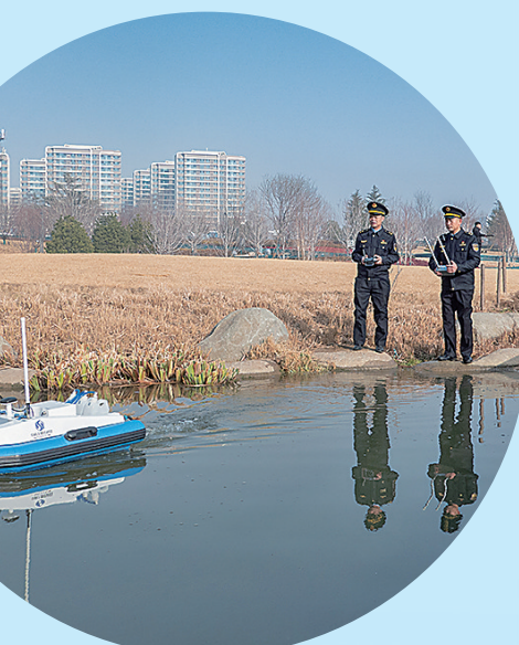
■生态环境执法人员在张村河开展无人船上巡检。