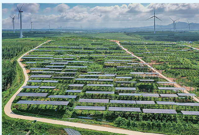
■西海岸新区光伏农业。