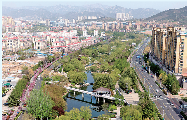
■俯瞰李村河。