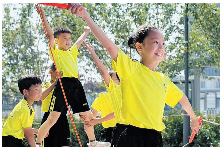
■150余名青少年参加2026年青岛市“俱乐部杯”跳绳公开赛。

数字海洋国际中心坐落于百年邮轮港区核心区域,依托区位优势,配套打造海洋科普研学、室内冲浪、室内滑雪等休闲体验项目,是为亲子家庭提供日常休闲、运动玩乐、科普学习的好去处。下一步,数字海洋国际中心将持续落地各类青少年小型文体活动,丰富周边青少年课余生活,为市民就近参与休闲运动、亲子互动提供便利。