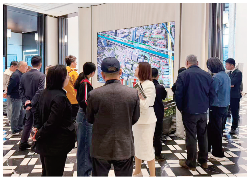
■日前，中海青云万里等项目吸引不少购房者看房选房。

当城市发展进入“品质时代”，房地产市场如何作答？青岛的答案是：拿出好地块，建设好房子。