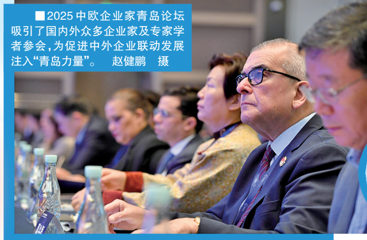
■2025 中欧企业家青岛论坛吸引了国内外众多企业家及专家学者参会,为促进中外企业联动发展注入“青岛力量”。