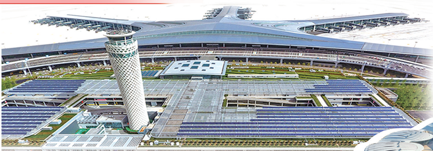
▲青岛胶东国际机场是青岛对外开放的“空中门户”。