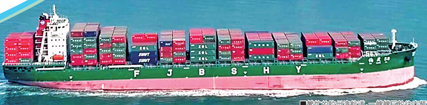
■繁忙的胶州湾航道,一艘艘巨轮往来频繁。

(上接第一版)这里将投入约8000万元研发资金,聚焦半导体及通用行业真空泵的关键技术攻关。