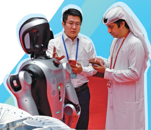
▲2025年6月,第六届跨国公司领导人青岛峰会如期举行,全球企业家们共赴“投资中国”的山海之约。