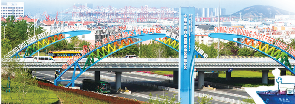
▲青岛自贸片区锚定对外开放,2025年探索形成31项高效能制度创新成果,其中,1项上升为国家制度规范,5项获国家部委创新备案或作为典型案例推广,25项获省政府及省级部门推广、认可。