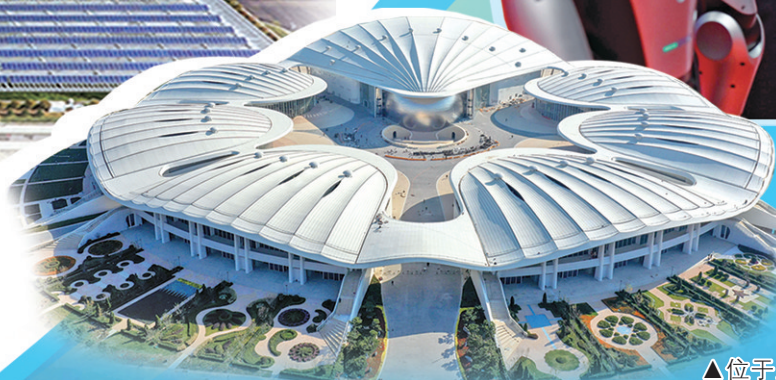
▲位于上合示范区的青岛·上合之珠国际博览中心,是集展、商、旅、文等多种业态为一体的商业综合体。