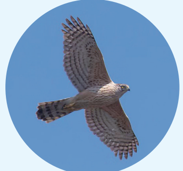
■展翅高飞的苍鹰。