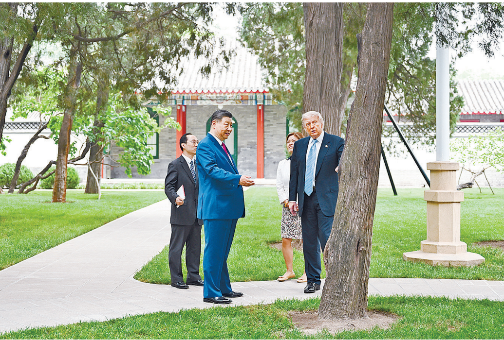
5月15日上午,国家主席习近平在中南海同美国总统特朗普举行小范围会晤。这是特朗普抵达时,习近平热情迎接。

■中美双方可以通过加强合作,促进各自的发展振兴 ■把准方向、排除干扰,推动两国关系稳定发展