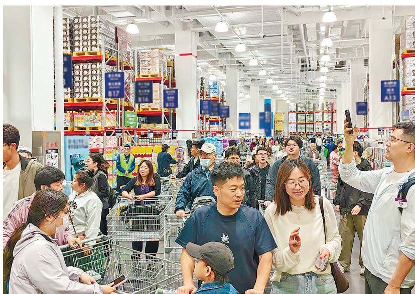
5月15日,青岛山姆会员商店正式开业,顾客进店购物。

记者在现场看到,不少顾客在熊猫毛绒玩具货架前拍照打卡,憨态可掬的熊猫玩具也成为不少人购物车里的“标配”。“这款熊猫不只是玩偶,拉开拉链后,里面还有小毯子,既可爱又实用。”工作人员指着身后超大号熊猫毛绒