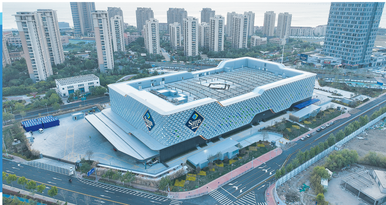
■青岛山姆会员商店。

此番青同同步落地，既是山姆抢抓北方高端消费风口的关键布局，也将直接搅动山东零售赛道竞争格局。那么，在此轮竞争中，青岛能得到什么？