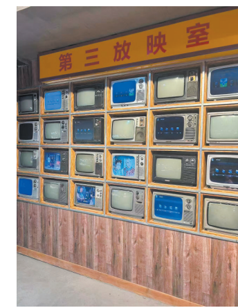
■早市上的复古装饰让人在烟火气中瞥见旧时光。