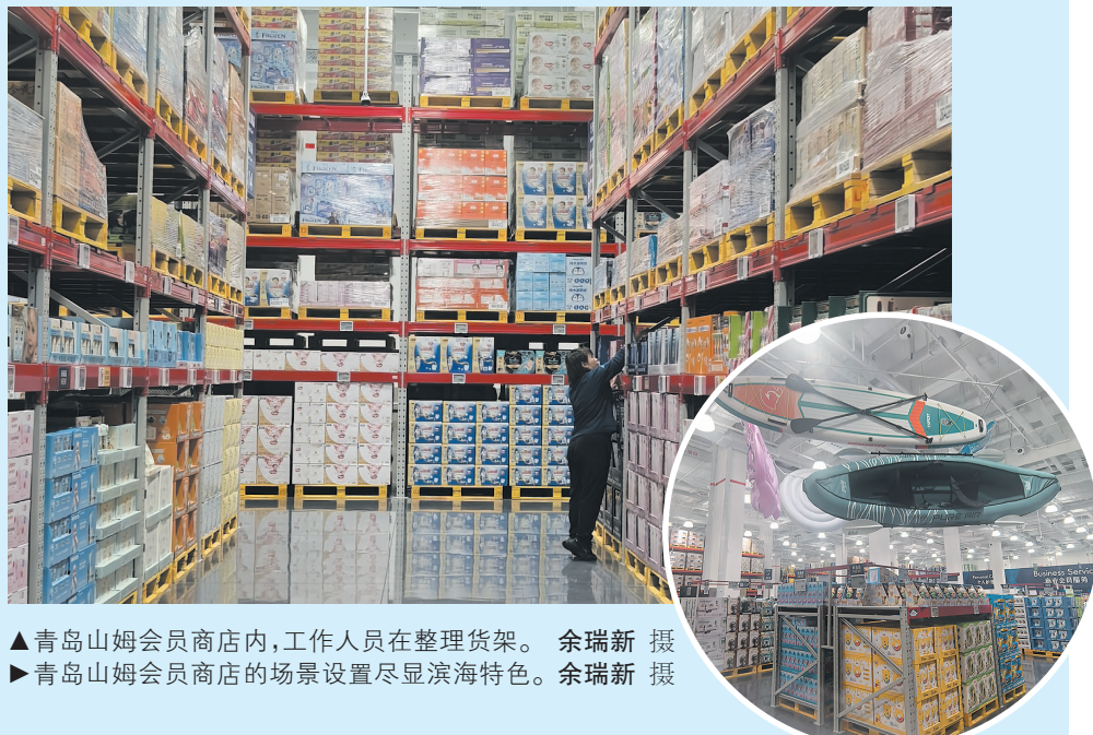
▲青岛山姆会员商店内，工作人员在整理货架。余瑞新摄 ▶青岛山姆会员商店的场景设置尽显滨海特色。余瑞新摄

值得关注的是，此次青同“双店同开”也各有巧思。两店虽然整体的装修风格和货品差别不大，但本地化特色十分明显。比如，山姆专为济南市场研发了把子肉；针对青岛市场，山姆则在场景上设置海滩度假、露营展示区和装备区，尽显海滨城市风情。