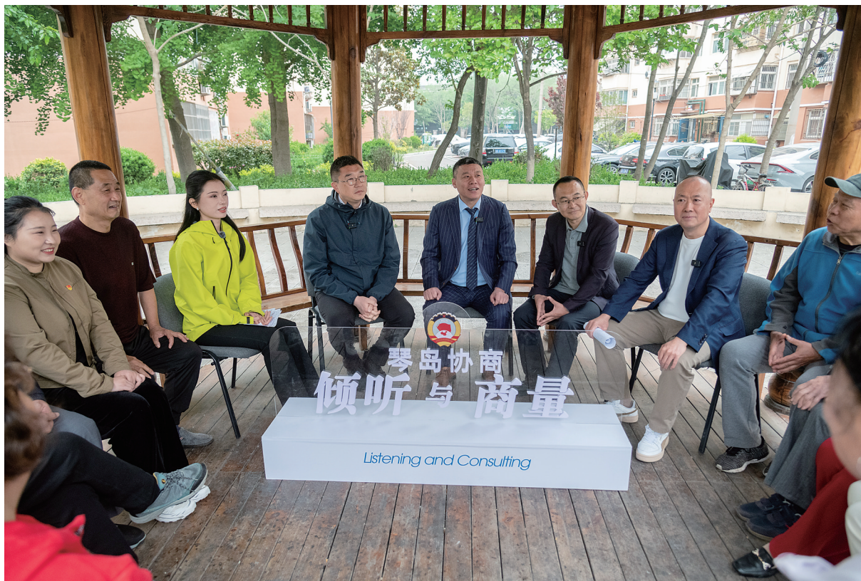
本期协商活动围绕“关注物业公司服务水平,提升居民优质居住体验”主题展开协商。

●制定权责清晰、条款细化的物业服务合同,建立常态化履约监管机制,破解物业服务质价不匹配问题。