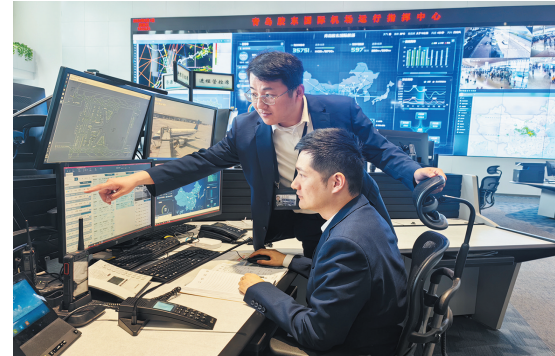
青岛机场运行指挥中心(AOC)指挥员在调度航班信息。