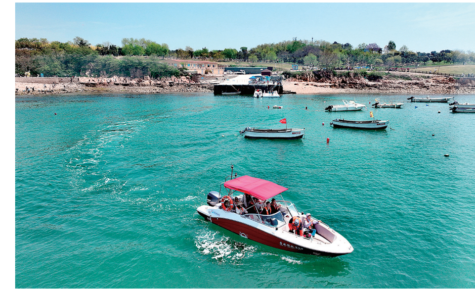
5月1日,小麦岛海洋旅游码头正式启用。