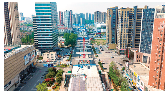
作为双山隧道及南延配套工程的重要节点,黑龙江南路正在进行系统改造提升。