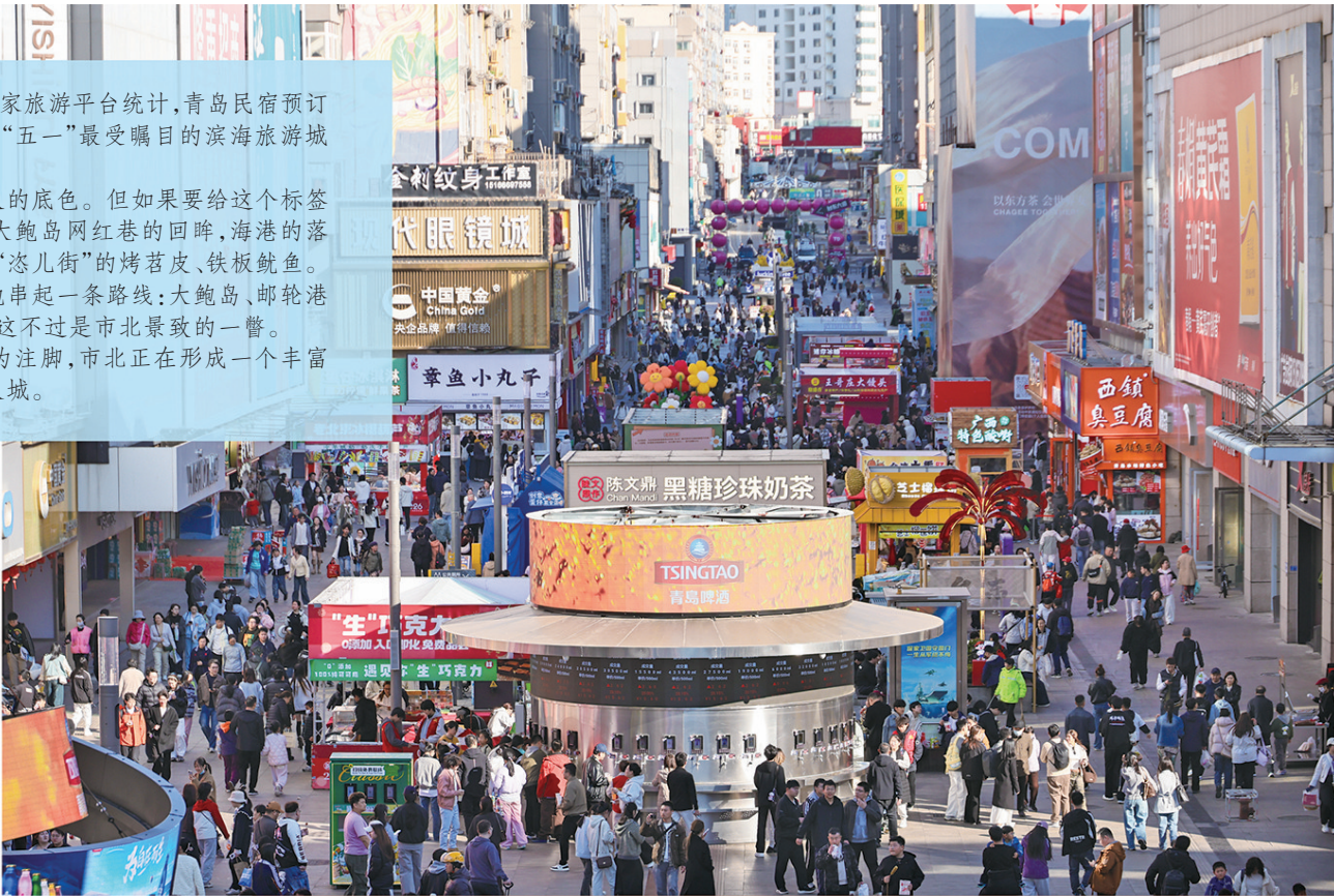
■台东步行街“青岛啤酒速递局”“时光海岸精酿所”让市民游客体验“买股式”喝酒的乐趣。

以历史韵味、现代时尚、风雅博物、老街烟火等为注解，市北正在形成一个丰富且立体的旅游目的地。漫步其中，才能读懂这座烟火城。