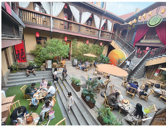
■游客在大鲍岛“荷田水铺”围炉煮茶，体验里院风情。