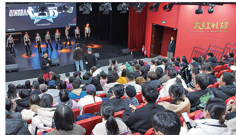
■大红礼娱·演出新空间内剧场爆满。

夜市、酒吧、KTV、灯光秀——如果提到夜经济，你的脑海里只能蹦出这几个词儿，那么你已经OUT了。伴随着城市发展以及新都市生活方式的浸染，以及居民对高品质、个性化消费的需求，夜经济已经不单单是日间经济消费时间和消费业态的延伸，而是从形