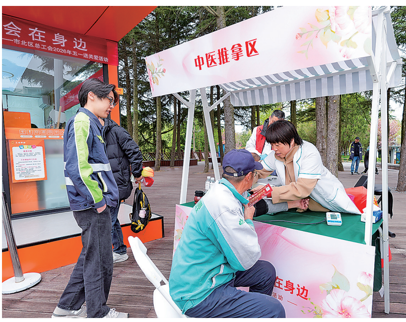
■浮山森林公园工会驿站前，中医师给新就业形态劳动者推拿理疗。

从商圈到社区，从移动服务到固定驿站，市北区总工会以多维度、广覆盖的服务网络，将健康守护、安全普法、生活便利与心理疏导精准送到劳动者最需要的地方。下一步，市北区总工会将持续弘扬劳动精神、劳模精神、工匠精神，深挖“大思政课”精神内涵，以“实、新、快、严”的作风标尺校准服务精度，不断推动阵地共建、部门协同、资源下沉，让贴心服务常态化直达基层末梢，让“工会在身边”的郑重承诺化为最温暖、最硬核的时代回响。