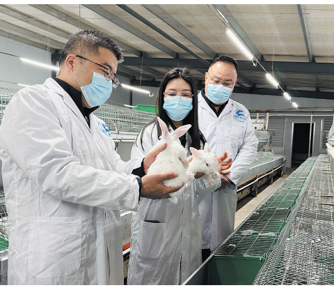
▲西海岸新区协作武都区挂职干部在甘肃康大兔业科技有限公司实地调研肉兔产业发展情况。

2026年是“十五五”规划的开局之年，也是两地协作迈向更高水平的关键之年。站在十年协作的新起点上，西海岸新区将继续坚持“武都所需、新区所能”，聚焦高质量发展主线，推动协作机制更加完善、协作领域更加宽广、协作成效更加扎实，以更大气魄、更实举措、更优机制，奋力谱写东西部协作高质量发展的崭新篇章，为全面推进乡村振兴、促进区域协调发展作出新的更大贡献。（王凯）