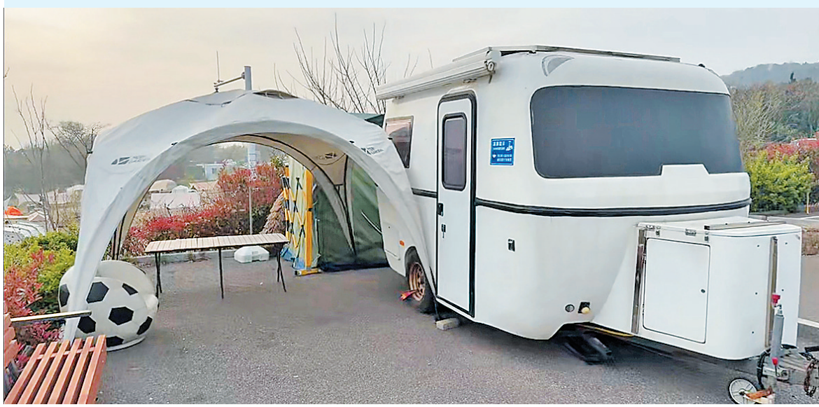
■在凤凰山公园停车场中,一辆拖挂式房车旁支起两顶帐篷。