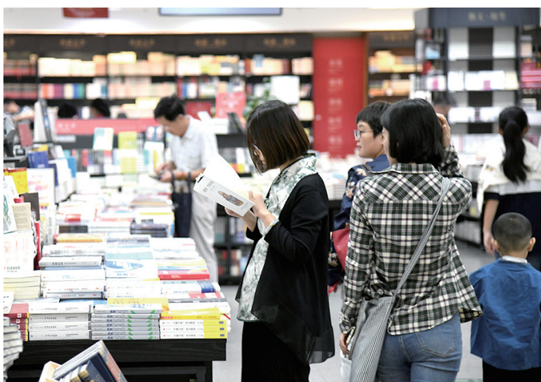
■在青岛书城，市民驻足阅读、选购图书。