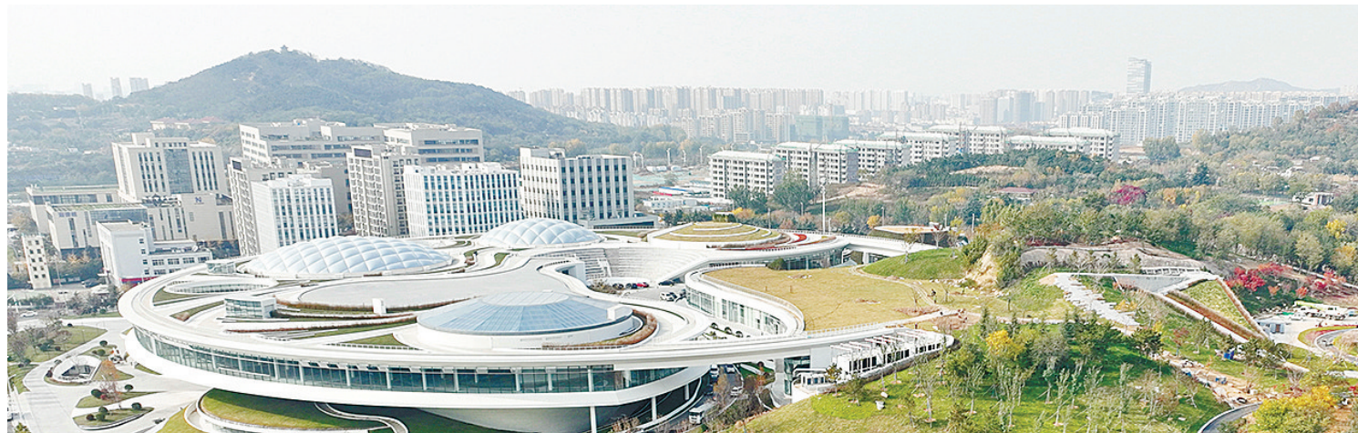
青岛虚拟现实创客中心俯瞰。