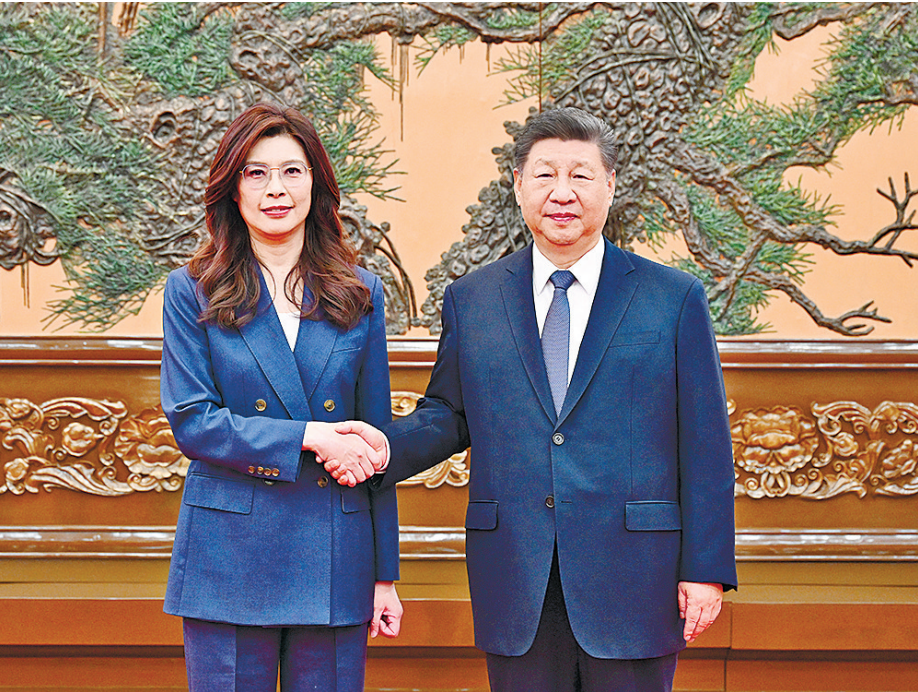
4月10日上午,中共中央总书记习近平在北京会见郑丽文主席率领的中国国民党访问团。